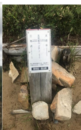
五光岩ベンチ標識