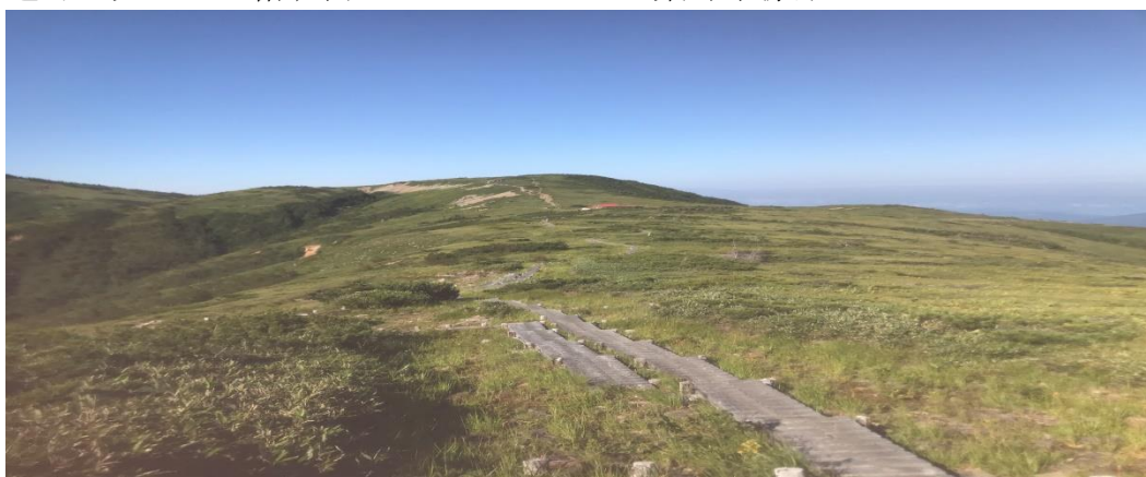
太郎兵衛平から太郎平小屋を臨む