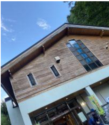
広河原インフォメーションセンター 行きます！

6時トラバース道八本歯のコルルートで下山開始→10時白根御池小屋で休憩→12時30分広河原インフォメーションセンター着→昼食→15時芦安駐車場→入浴→16時帰路へ→20時頃湾岸長島PAで夕食→23時和歌山着、解散