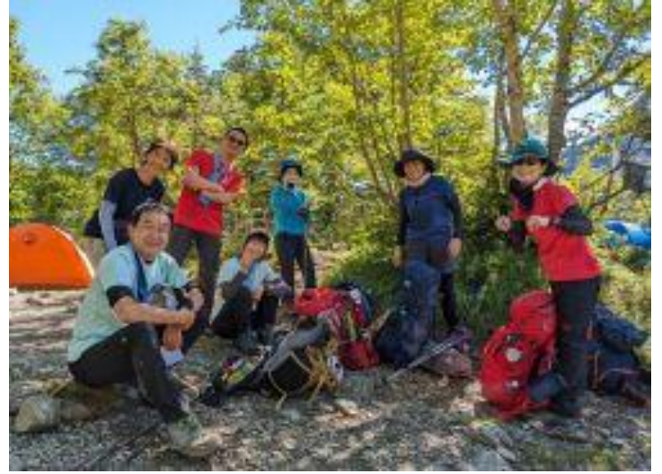
白根御池で休憩タイム