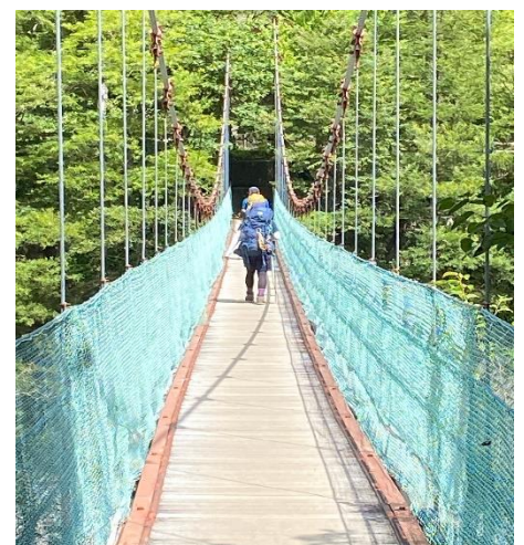
野呂川の緑の吊り橋

18時、10人乗りのレンタカーに乗り和歌山出発。御在所SAで夕食。その後、物凄い大雨にあい、運転も困難なほどだったのですが、芦安駐車場では星空が見えていました。