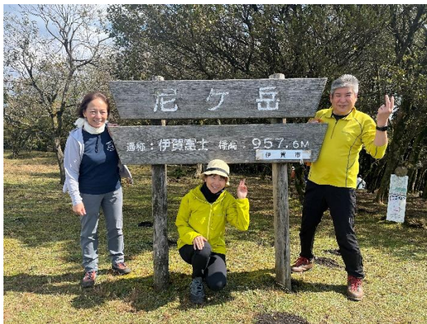
ニヶ岳山頂 (957.6m) 通称 伊賀富士