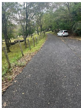
スカイランドおおぼら駐車場