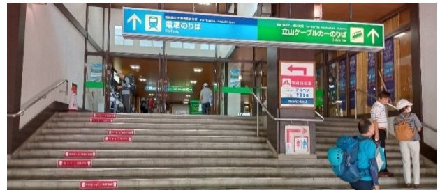
【モンベルのある待合室】

外は灼熱地獄のような暑さで、待合室で涼む。待合室にはモンベルがあり、クーラーが効いているので、電車の予約時間までゆっくり休憩