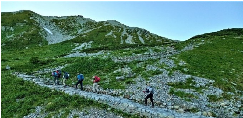
【一の越から雄山への登りの途中】