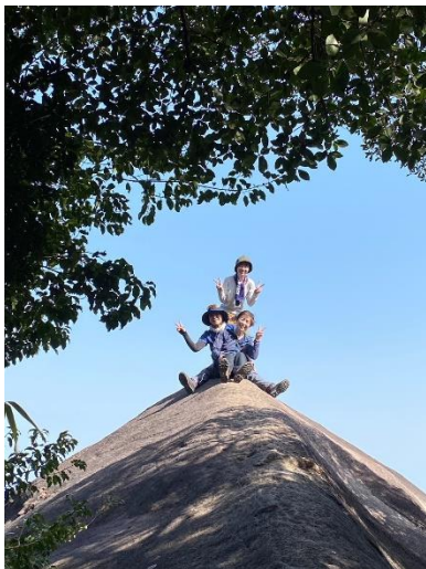
便石山の象の背で記念写真