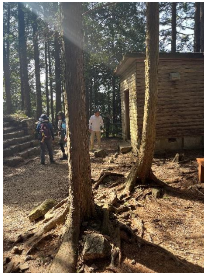
馬越峠の避難小屋