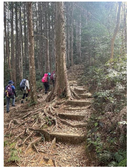
天狗倉山へ向かう階段道