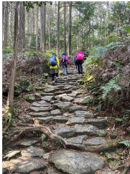
熊野古道伊勢路の石畳