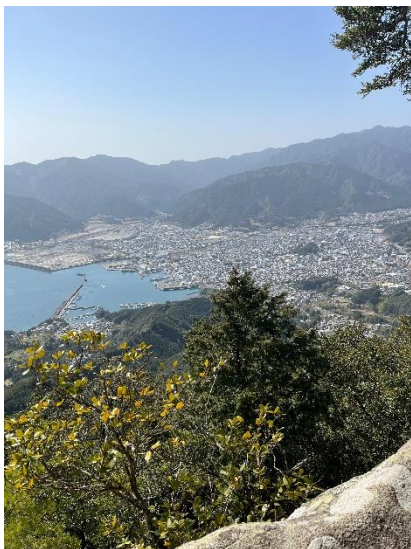
天狗倉山山頂からの景色