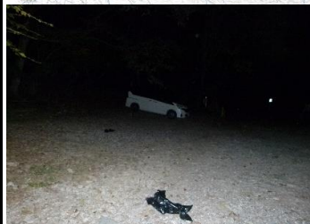
↑下山時真っ暗な中に ポツンと1台