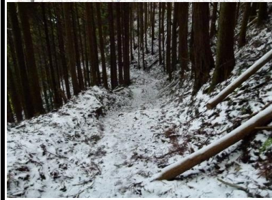
←雪の行軍となりました