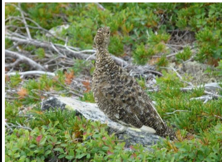
↑ 今回のらいちょう親