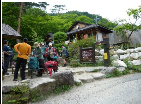
↑ 中房温泉から出発