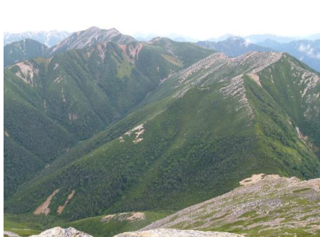
↑ 常念岳山頂より燕岳・大天井岳