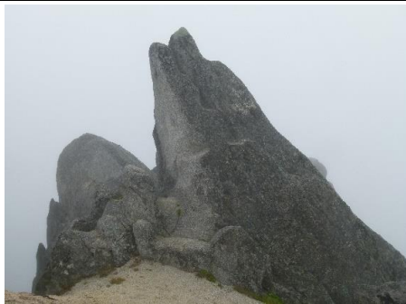
↑ 燕岳お約束のイルカ岩