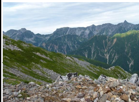
↓ 穂高連峰と槍ヶ岳