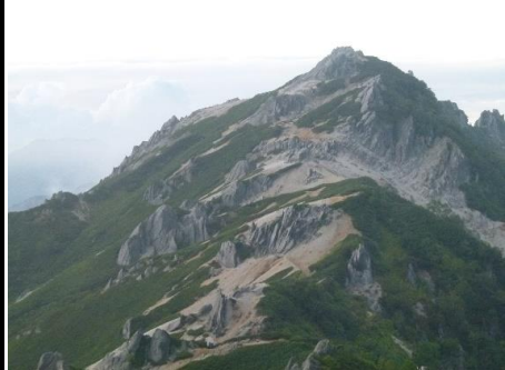
↑ ガス晴れて燕岳が姿現す