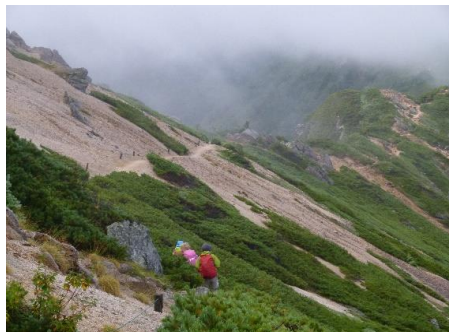
↑ これから歩く道がハッキリ