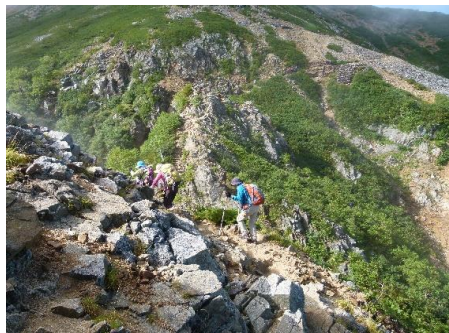
↑ 大天井岳への岩場(切通岩?)