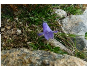
出会った花 ↓ ← ↓