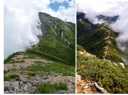
↑ 東大天井から常念岳 ↑ 歩いてきた道