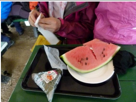
↑ 合戦小屋でお約束のスイカ