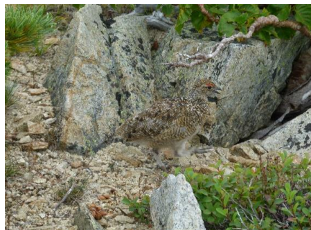
↑ らいちょうのヒナ