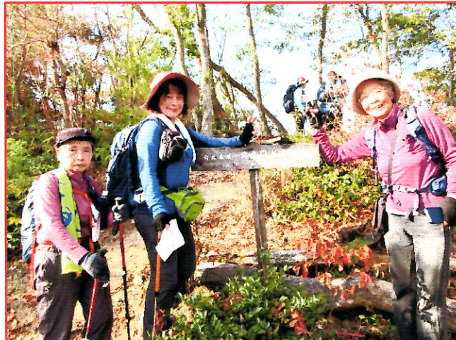
(写真6) (北ノ庄城跡展望台)

・百々神社の登山口から8時過ぎにスタート スタート直後から急登であるが、落葉風景 と、踏みしめる音が心地よい。