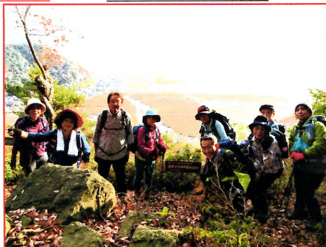
(写真4) (近江八幡の田園風景)