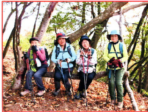
(写真 10) (天然木イスで休憩---1)