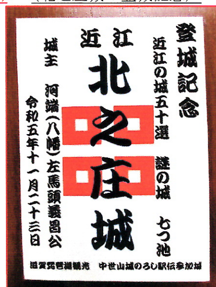
(写真8) (北之庄城の登城記念)