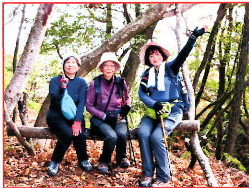
(写真 11) (天然木イスで休憩---2)