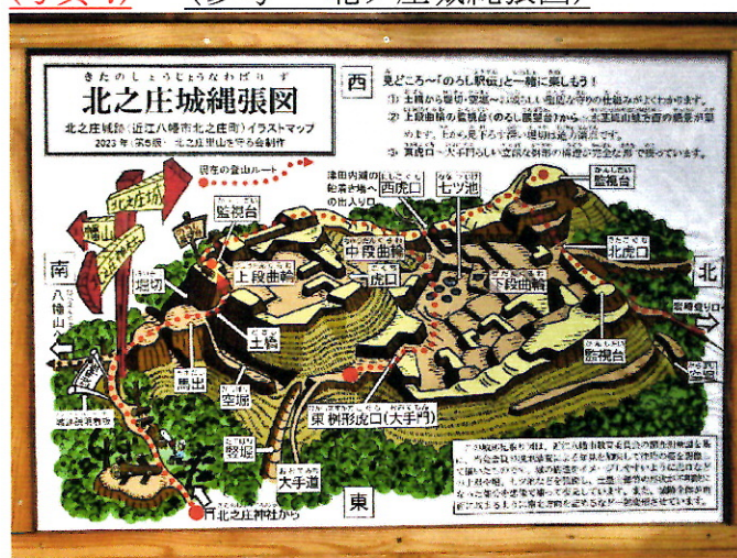
(写真7) (参考—北ノ庄城縄張図)