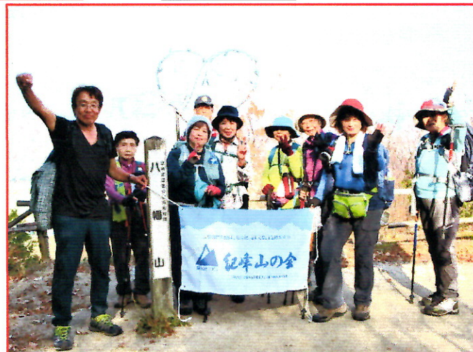
(写真 12) (八幡山山頂)