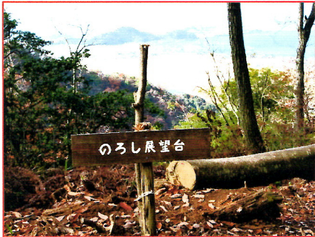
(写真 9) (のろし展望台)