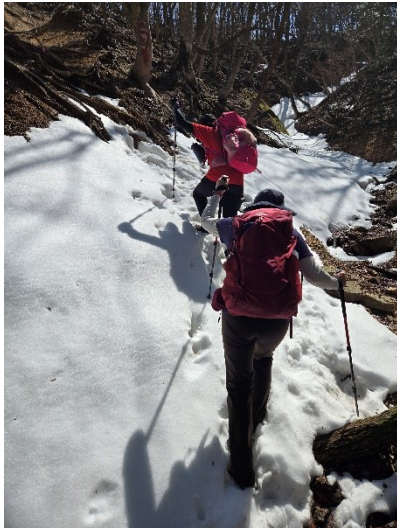
【途中から残雪あり】