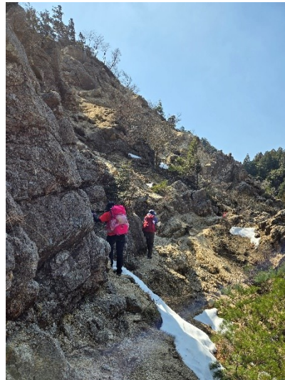
【ザレ場のトラバース】