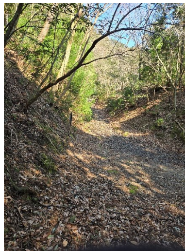
【隣の間違った登山道】