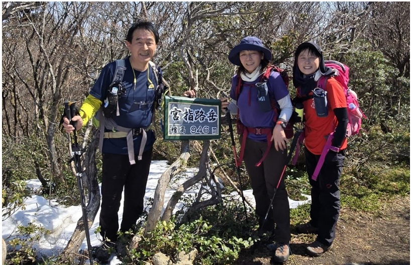
【宮指路岳山頂にて】