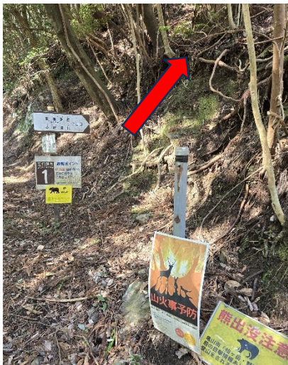
【本当の登山口（急登）】

渡渉あり、途中から残雪があり、やせ尾根とザレ場があり気の抜けない山でしたが、鈴鹿山脈の絶景と奇岩を堪能することができました。