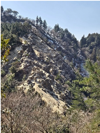
【奇岩、ザレ場の登り】