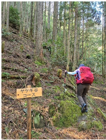
【正しい登山道ヤケギ谷】