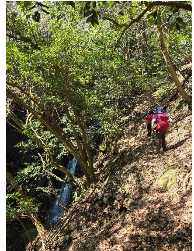
【滝の隣のトラバース】