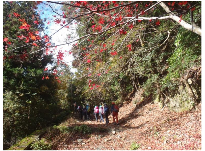
真っ赤なモミジの中を歩く