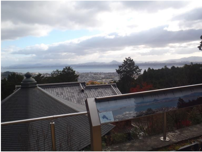
琵琶湖の向こうに見える三上山