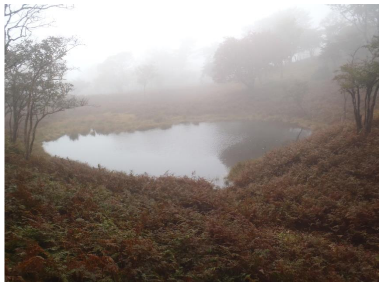
赤ゾレ山から少し進むとハート池 見 る方向によってはハート形に見えます