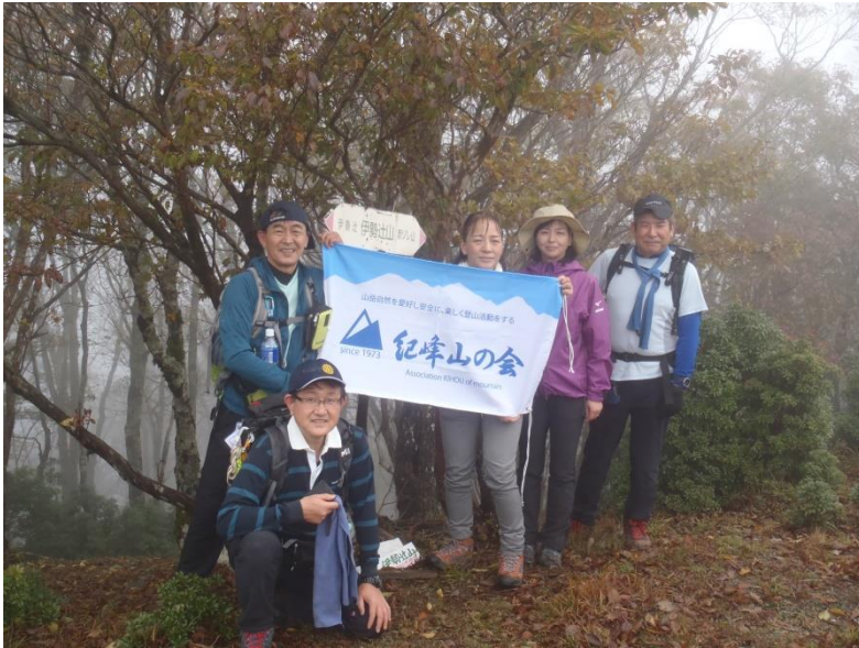
20分で伊勢辻山山頂到着 前回の 大山山行に引き続き真っ白なガス の中 展望もありません