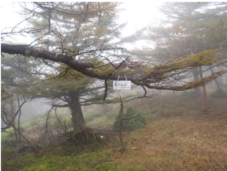
稜線を引き返して明神平方面に進む 30分で赤ゾレ山山頂に着きます