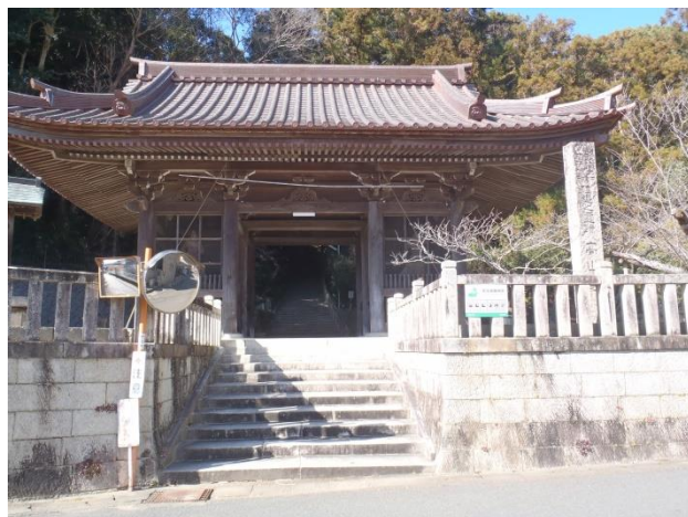
南方熊楠のお墓のある高山寺の前を通り大師橋を渡ると