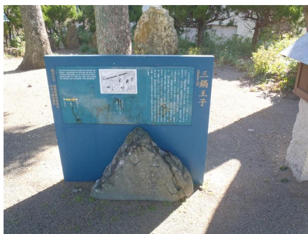
境内には王子碑がある