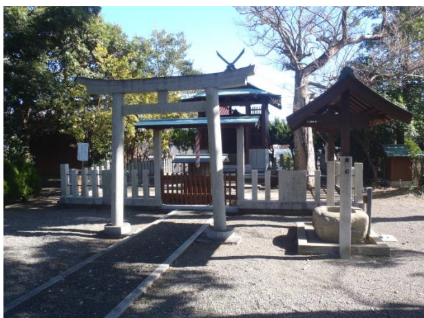
そのすぐ先に三鍋王子