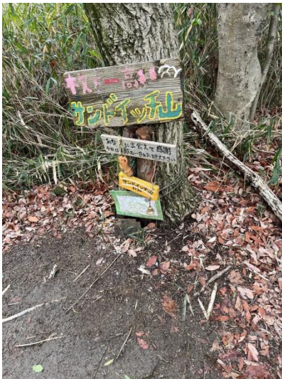
←サンドイッチ山山頂

サンドイッチ山の名前は標高が 313m で 1 を 3 で サンドしているからだそうです