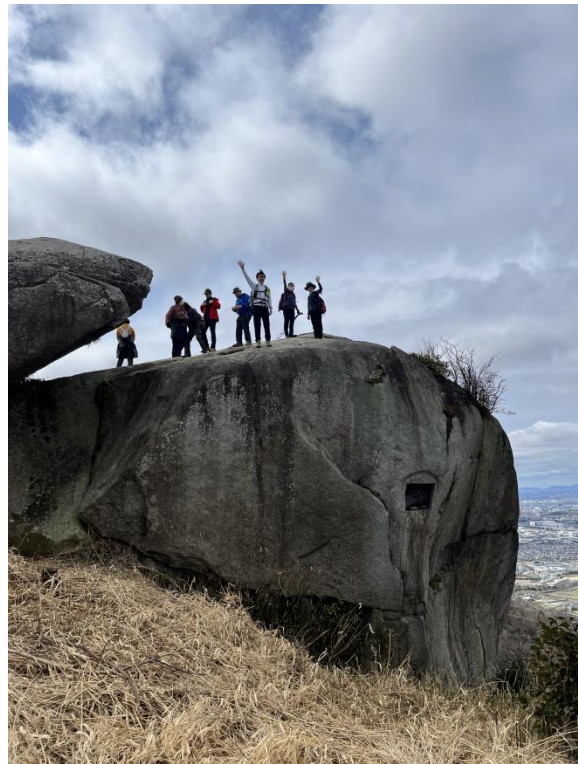
交野山山頂の観音岩→

サンドイッチ山の名前は標高が 313m で 1 を 3 で サンドしているからだそうです