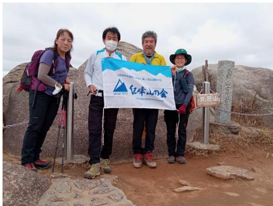
交野山山頂で記念撮影