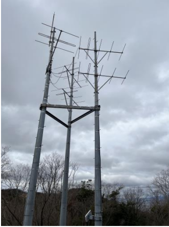
←アンテナ山由来のアンテナ