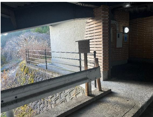
奥の院前の駐車場の奥から登ります

帰路に丹生酒殿神社の大銀杏を見に行きましたが見物の人がいっぱい臨時駐車場も車でいっぱいでした。