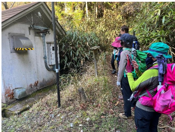
大門に到着 横にはまだ紅葉が残っていた