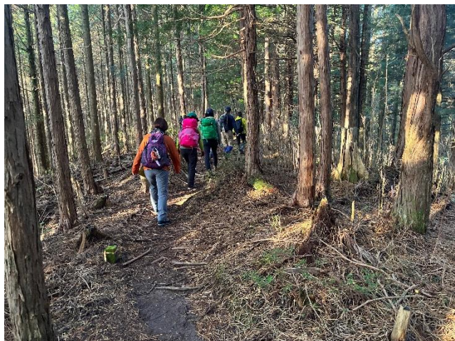
登山道はよく整備されています