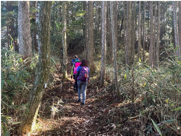
女人堂の横から高野三山方面への道 こちらも女人道です