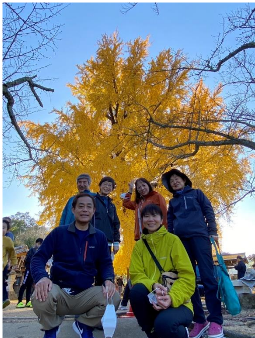
帰路で訪れた丹生酒殿神社の大銀杏