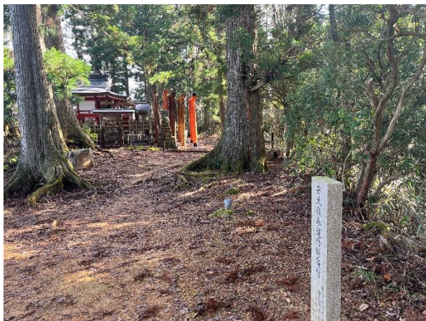
不動坂口女人堂 唯一残る女人堂