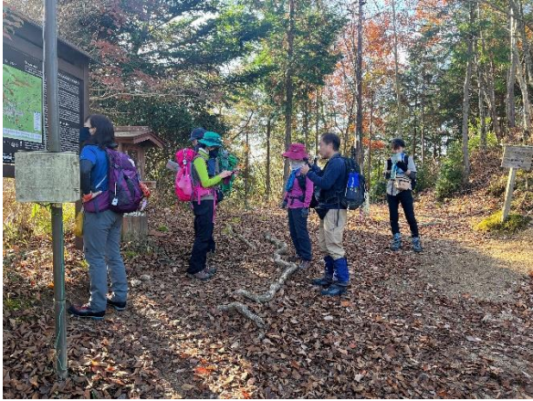
展望が開けたところ