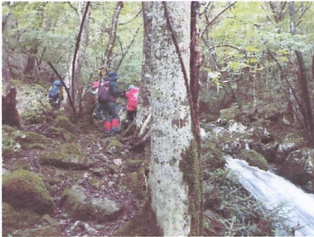
キノコがいっぱいです