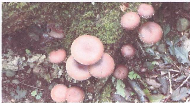
タマゴダケ 美味しいらしい