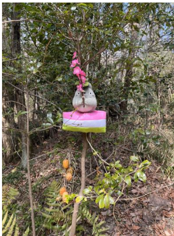
ひし餅に座るトトロ