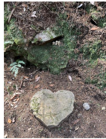
ハート石と3人の童子