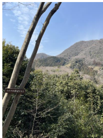
ふたがみ展望テラス