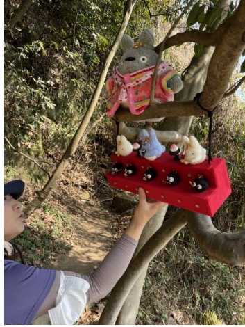
かくれ坂のトトロおひな様バージョン