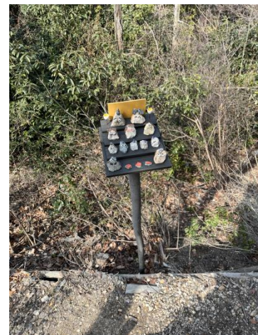
テラスにあったオブジェ