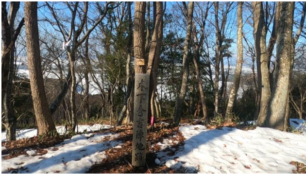
虎御前山山頂 (229m) 木下秀吉陣地跡