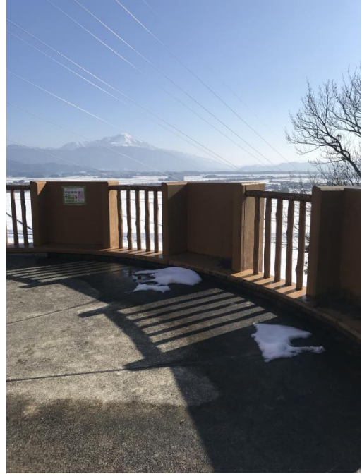
展望台からの伊吹山