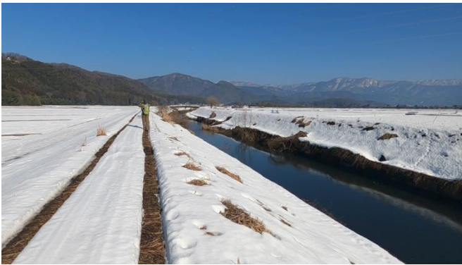
下山後の川沿い道 駐車場に戻ります