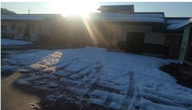
小谷城跡ガイド館 ここに車を駐車

彦根を過ぎたあたりから、車窓からの景色は雪景色が続きました。小谷 IC を下りると 5 分ほどで小谷城跡ガイド館に到着、駐車場に車を置いて登山準備後出発。車道を 15 分ほど歩くと虎御前山北登山口。登山道は積雪はあるもののツボ足で歩けるくらいでした、登山道もよく整備されていて道迷いはない。山頂手前に夫婦岩の標識があったので見学に行くが急坂下りのため軽アイゼンを装着、D の軽アイゼンが経年劣化で使えなかったので分岐で待つことに。夫婦岩は 2 つの大きな岩があるが、特に表示もなく敢えて見に行くほどのものではなかったらしいです。戻ってきたメンバーと合流後、虎御前山山頂、織田信長陣跡、丹羽長秀陣跡を右には琵琶湖、左に伊吹山を見ながら尾根歩き。公園広場や展望台からの眺望も最高でした。虎御前山南登山口に下山して川沿いの雪道を歩き駐車場に戻ってきました。本来計画では、この後小谷山に登る予定でしたがゆっくり歩いたため予定を大幅に遅れていたため今回はここまで昼食を済ませて帰路に着きました。