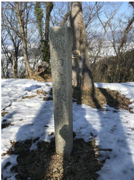
織田信長陣地跡 虎御前山最高地 (249m)