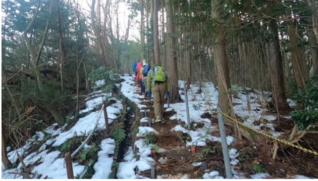
綺麗に整備された登山道