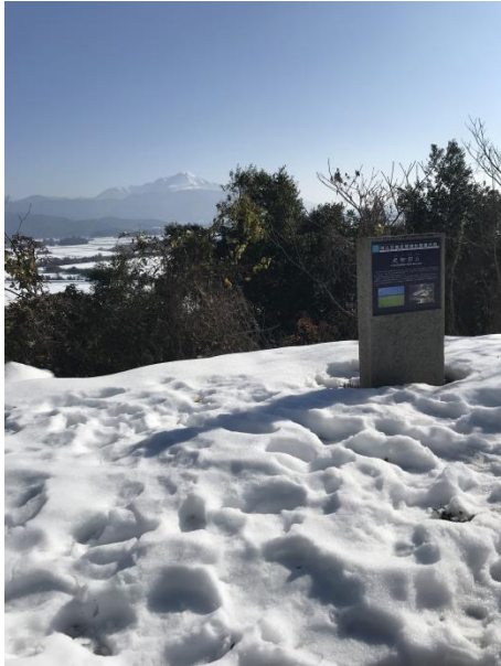
公園広場からの伊吹山