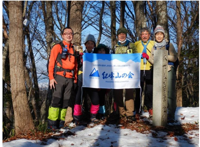
山頂での記念写真