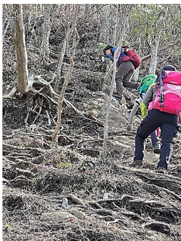
【兜岳への厳しい登り】