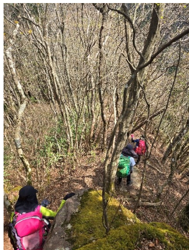
【兜岳から逢坂峠への下り】