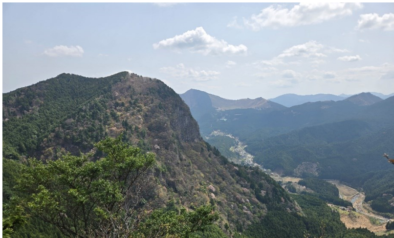
【兜岳からちょうど1時間で鎧岳山頂へ】