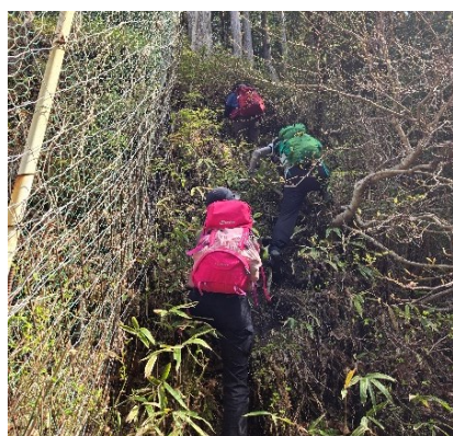
【両手両足を使ってよじ登る】