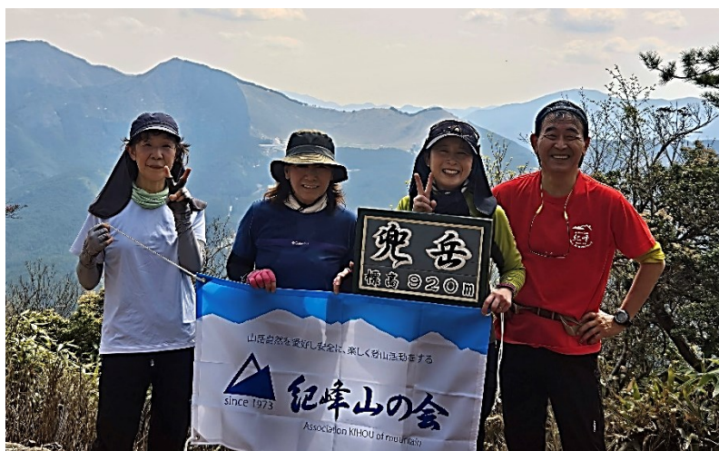
【兜岳頂上にて記念写真】